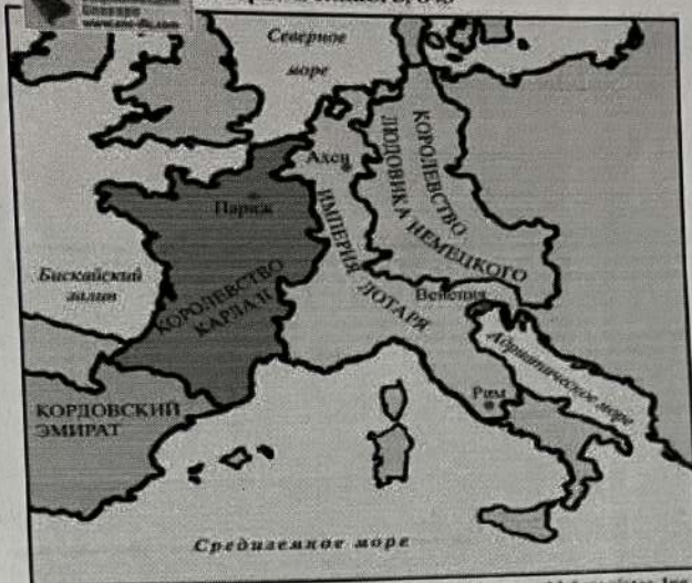
Результат Империум Карла Великого, 843