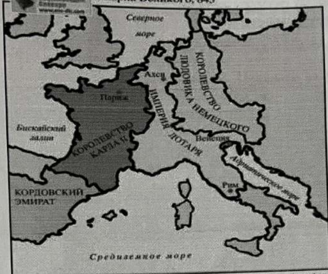
Рисунок 14. Империя Карла Великого, 843